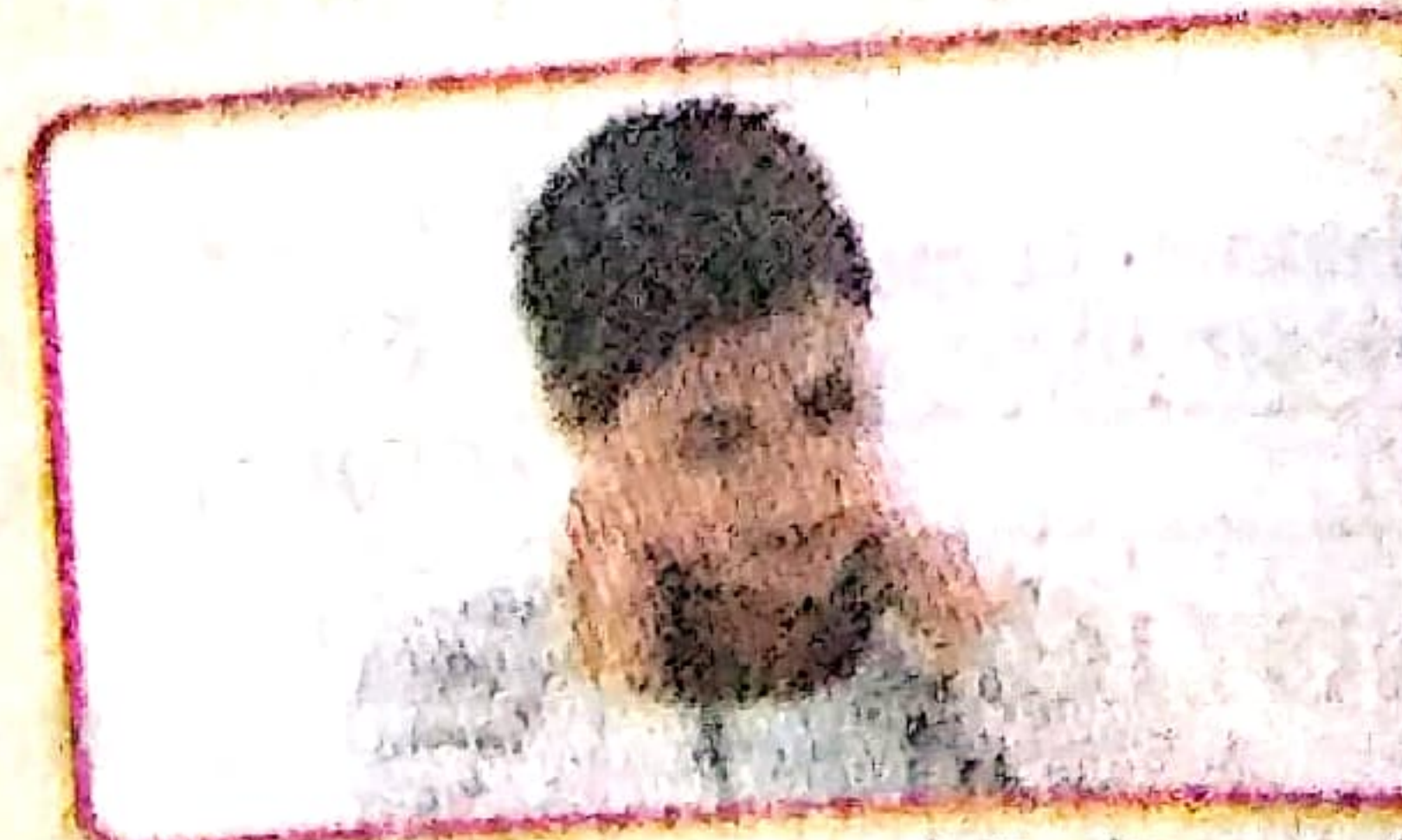
सिर दर्द, मासपेशियों एवं जोड़ों में दर्द