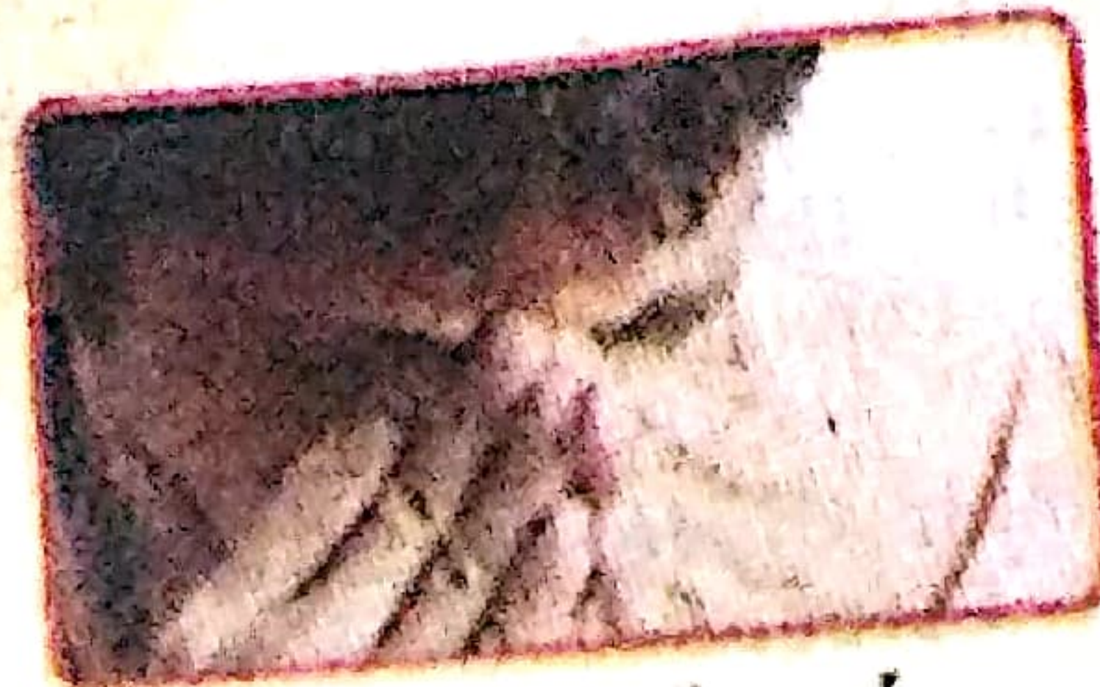
आंखों के पीछे तेज दर्द, जो आंखों के घुमाने से बढ़ता हो