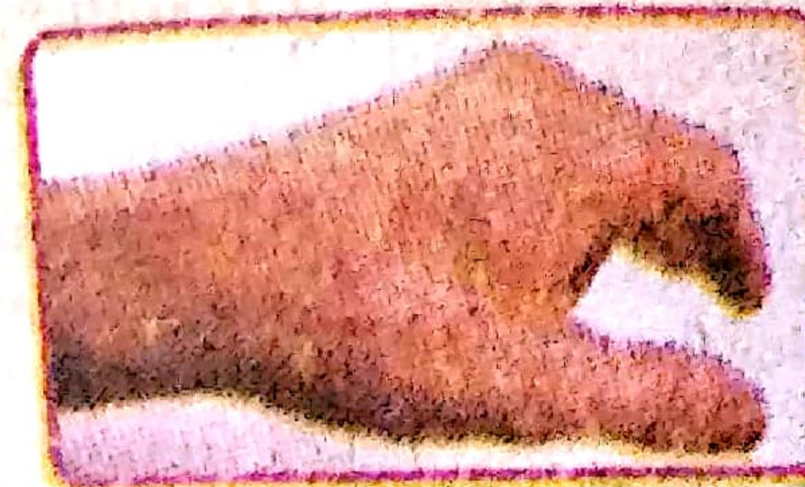
शरीर पर दाने निकलना