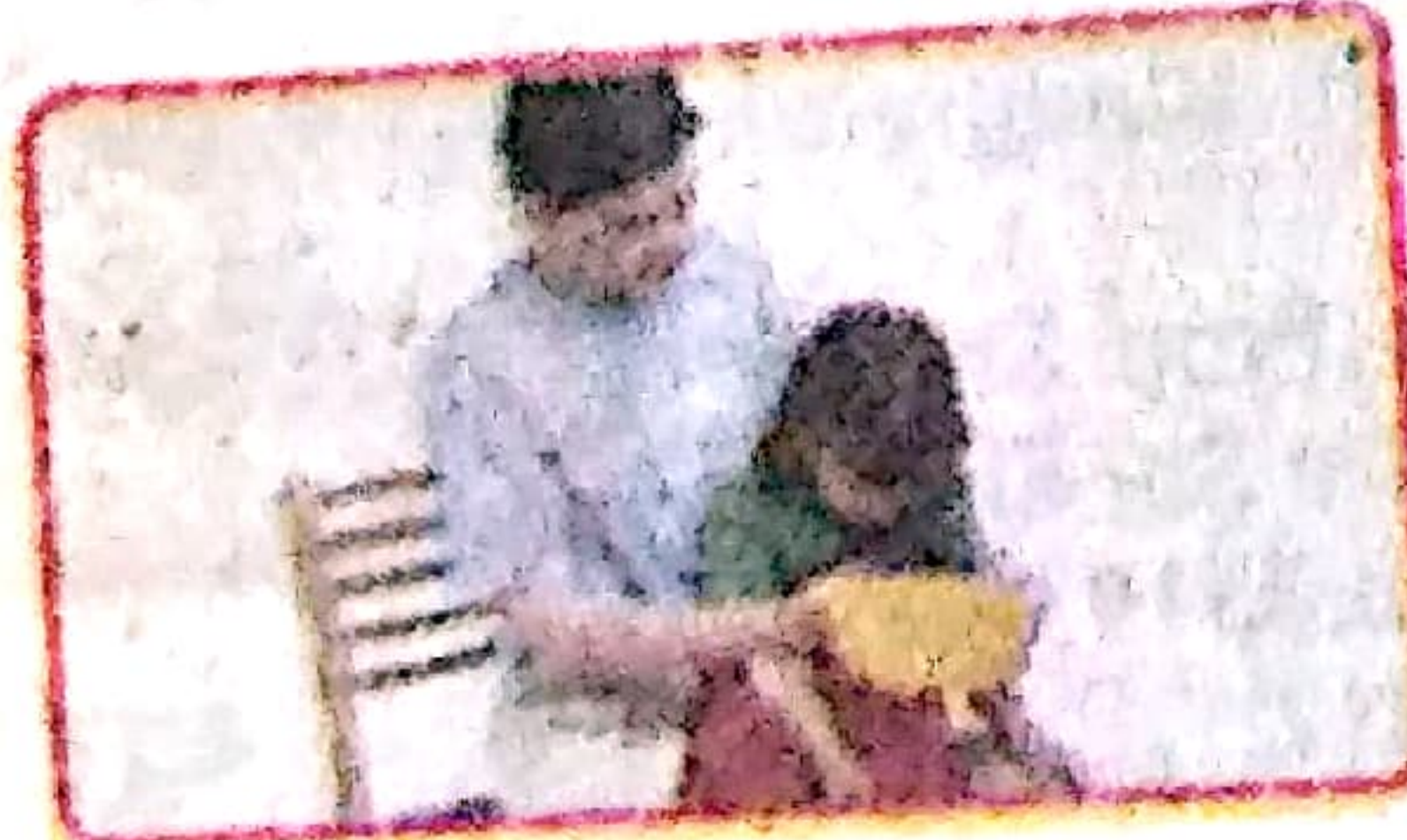
जी मिचलाना, चल्ती आना